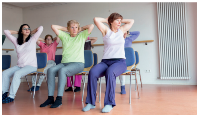
Voorbeeld overgenomen van de website:

Een paar organisaties uit de beweging DE STAP naar gezonder hebben samen deze website gemaakt. Maar DE STAP naar gezonder is vooral van en voor jou. We willen deze website samen met inwoners, wijken en buurten verder verbeteren en daarbij aansluiten bij wat jij en andere inwoners nodig hebben. Heb jij een vraag, tip of idee voor DE STAP naar gezonder? Laat het ons weten!